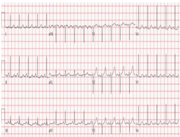
Electrocardiogram( EKG): Sinus Takikardia